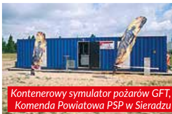
Kontenerowy symulator pożarów GFT, Komenda Powiatowa PSP w Sieradzu