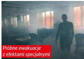
Próbne ewakuacje z efektami specjalnymi